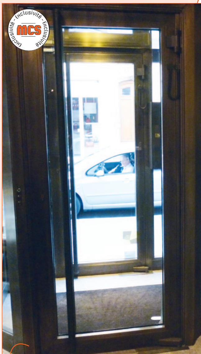
Réf. SAS avec asservissement

1/ Transfert de criminalité - 2/ Repartition des risques 3/ Ralentir l'effraction